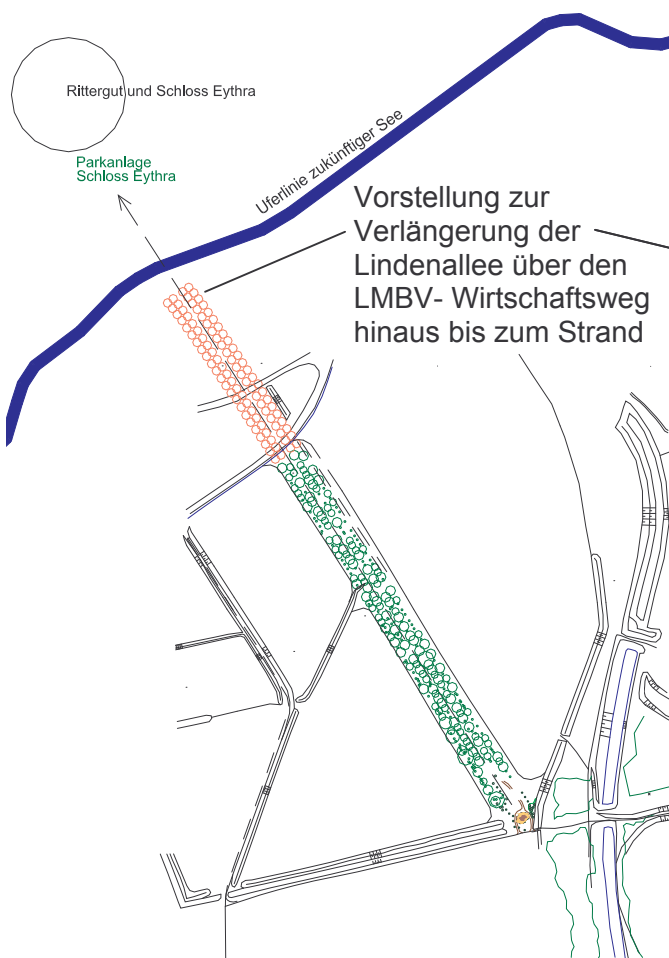
Flurkarte des Gebietes (Grafik: AQUiLA)