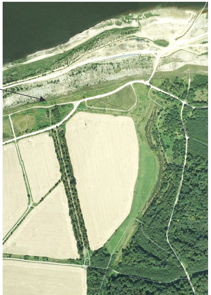
Luftaufnahme der Lindenallee

Ihre Spenden erbitten wir unter Kto.-Nr. 1100140049 bei der Sparkasse Leipzig, BLZ 86055592, Verwendungszweck „Lindenallee“